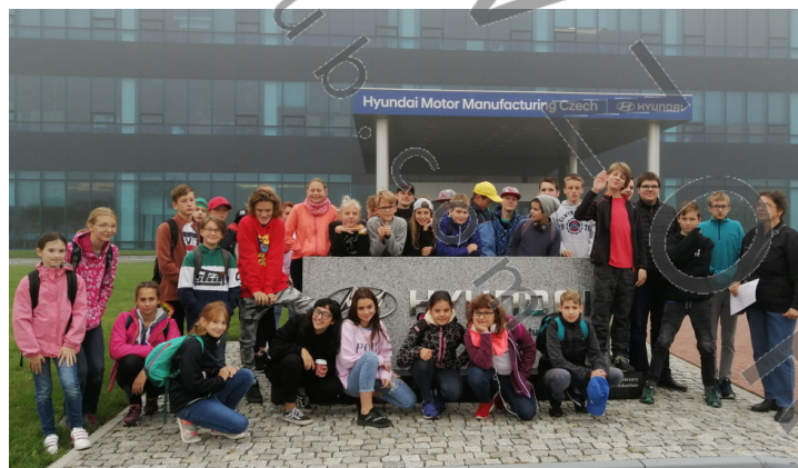
Exkurze do automobilky