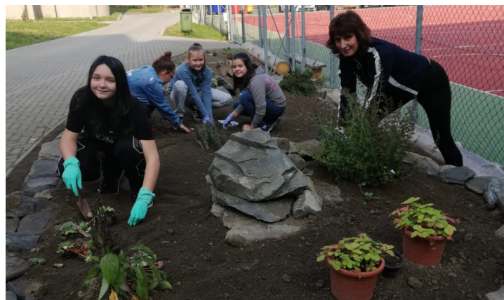
Práce na naší bylinkové spirále.