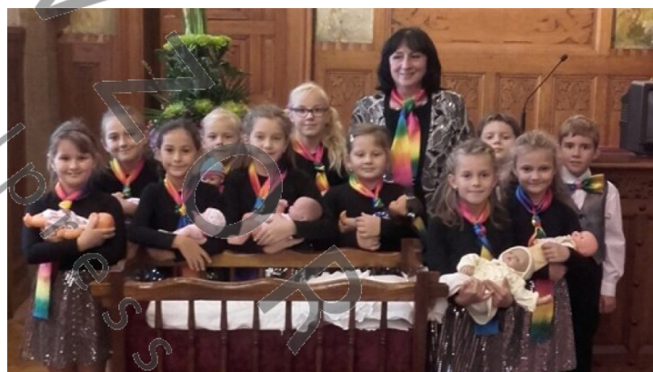
Vítání miminek na radnici.