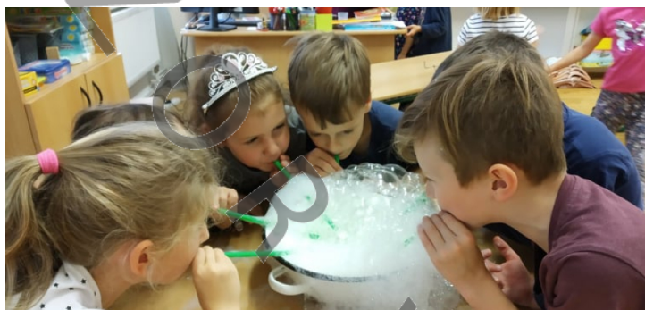
Bublání v 1.A.