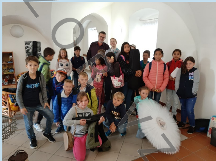
Úspěšné vystoupení žáků IV.A v Hospici na Svatém Kopečku