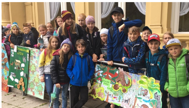
Akce Oslava lesa, které se