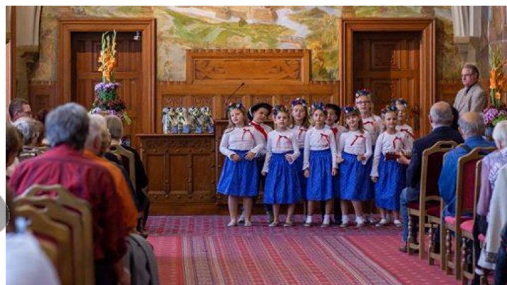
Vystoupení dětí školní družiny pro seniory.