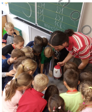
suchým ledem v 1.B