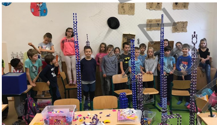
Architekti ze 4.BĚ