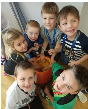
Vyrábění dýní a pokusy se